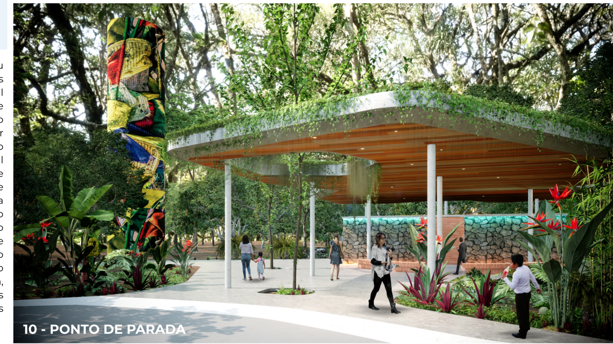
10 - PONTO DE PARADA