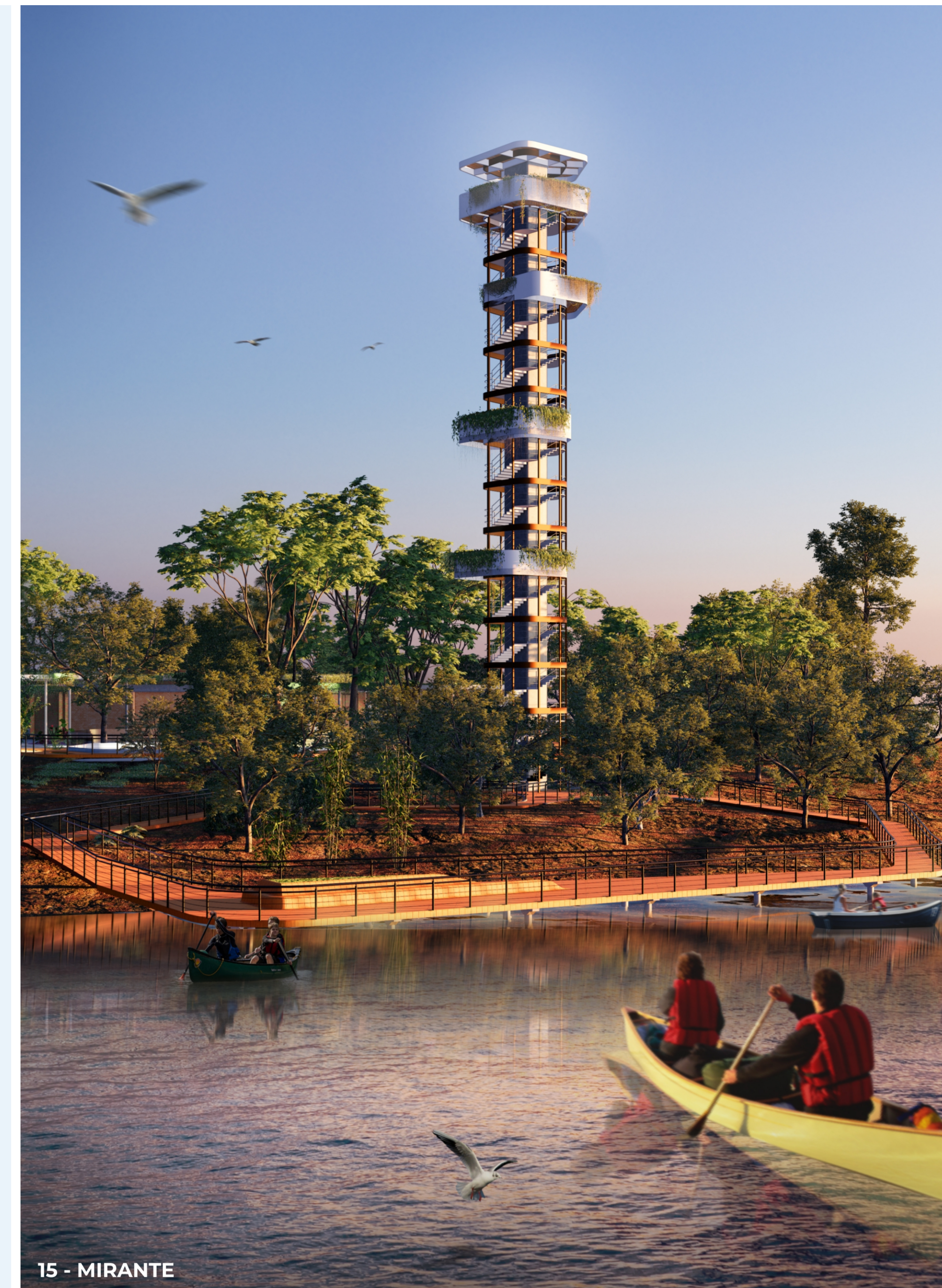
15 - MIRANTE