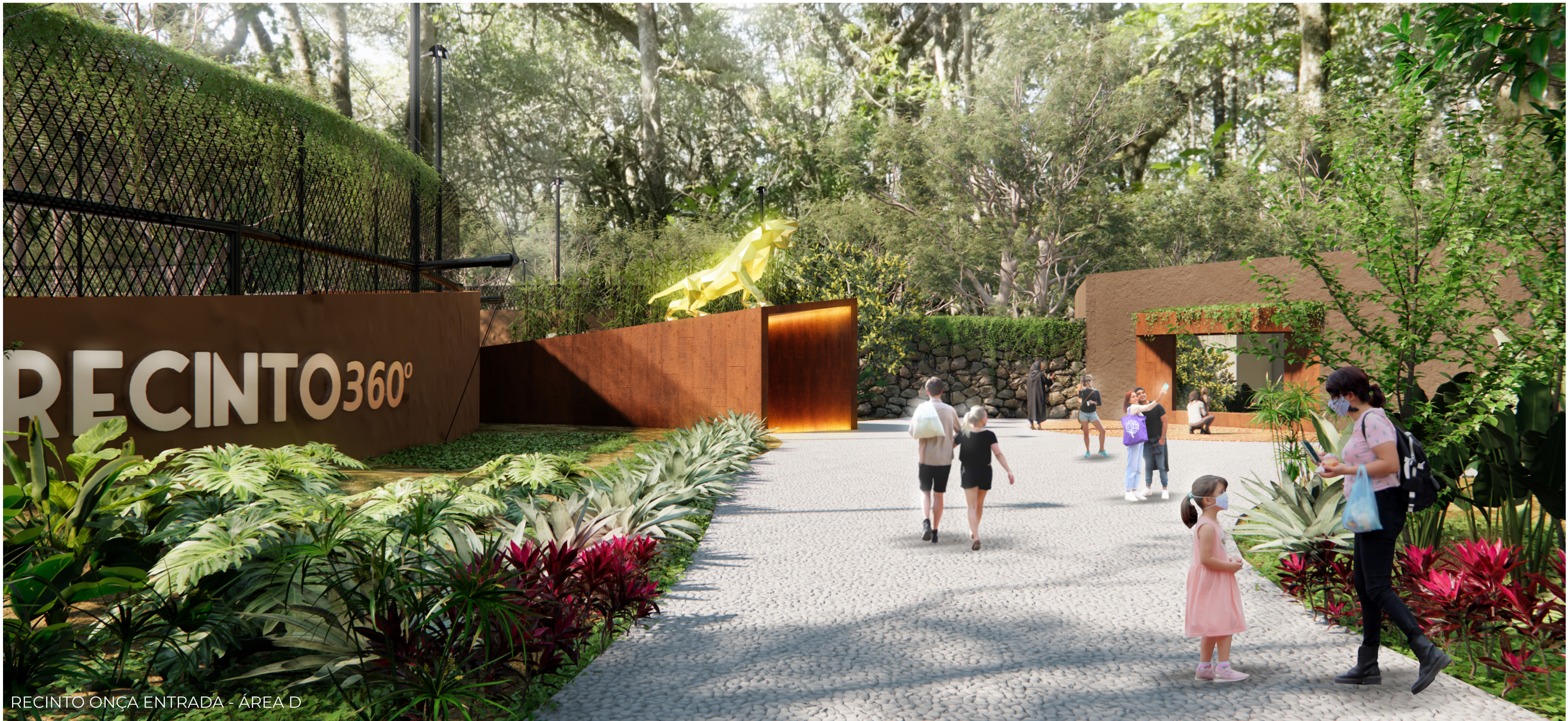
RECINTO ONÇA ENTRADA - ÁREA D