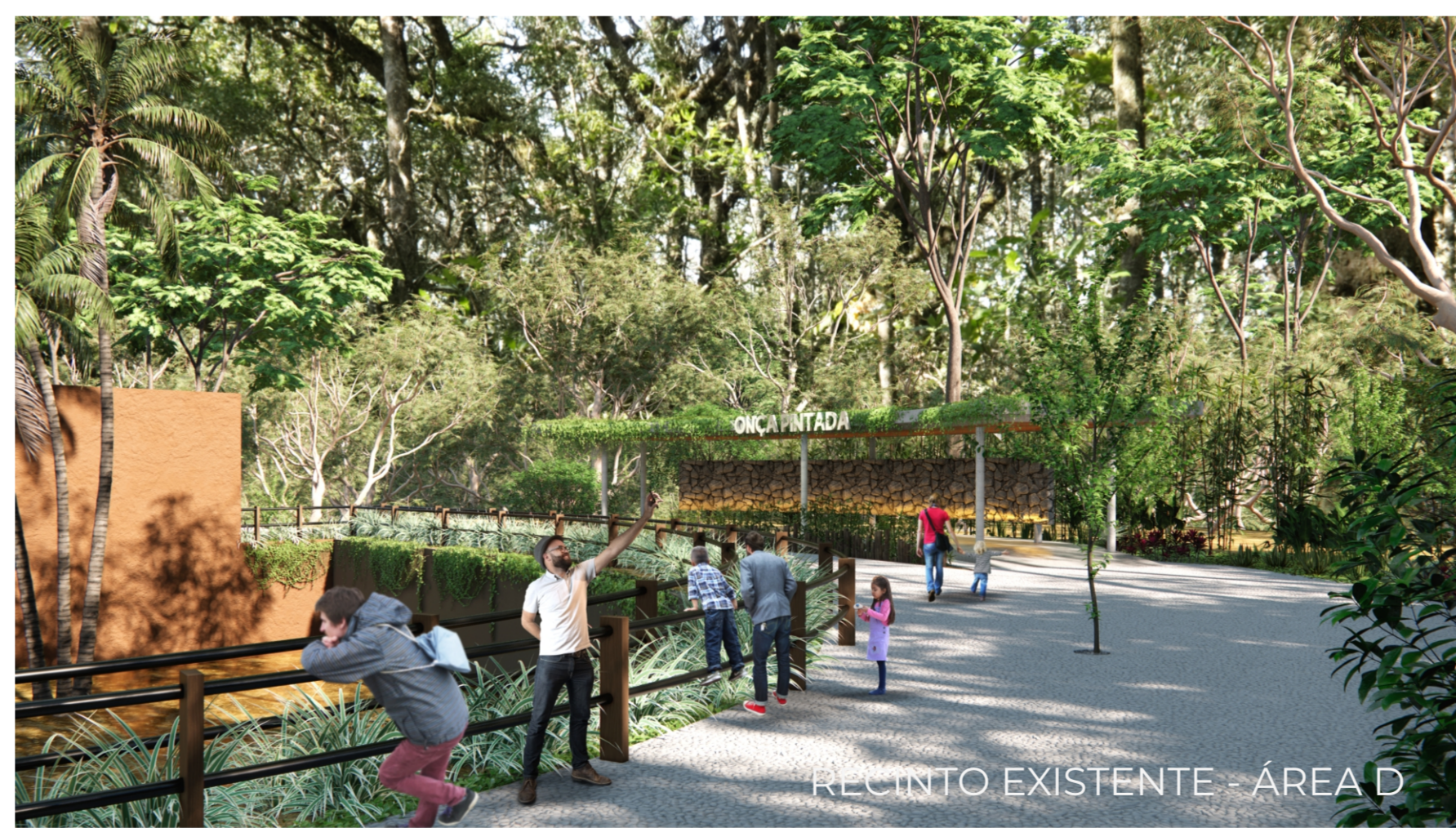
RECINTO EXISTENTE - ÁREA D