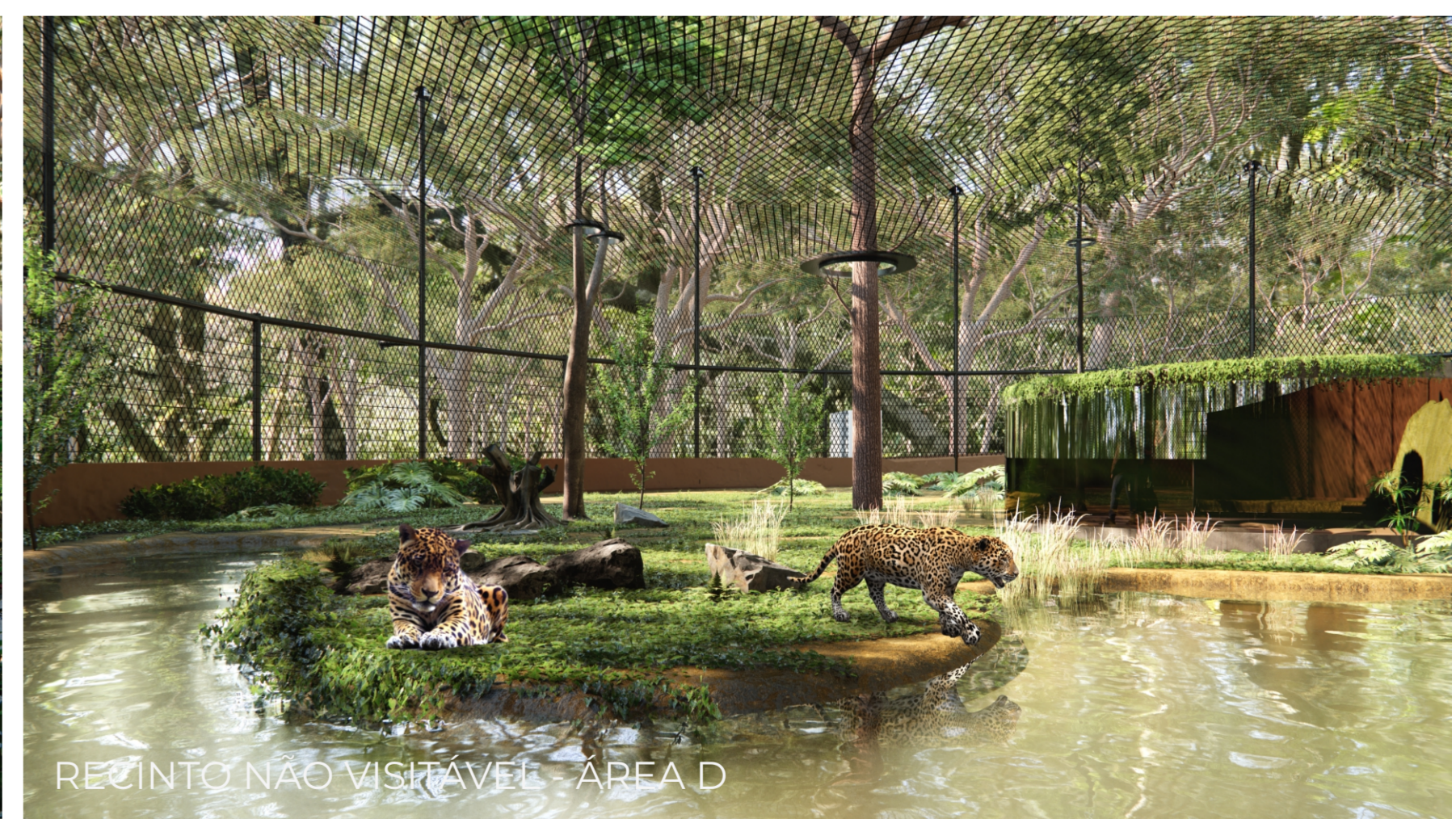
RECINTO NÃO VISITÁVEL - ÁREA D