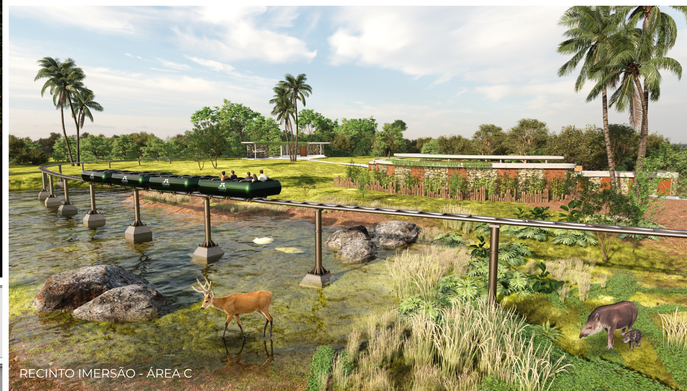
RECINTO IMERSÃO - ÁREA C