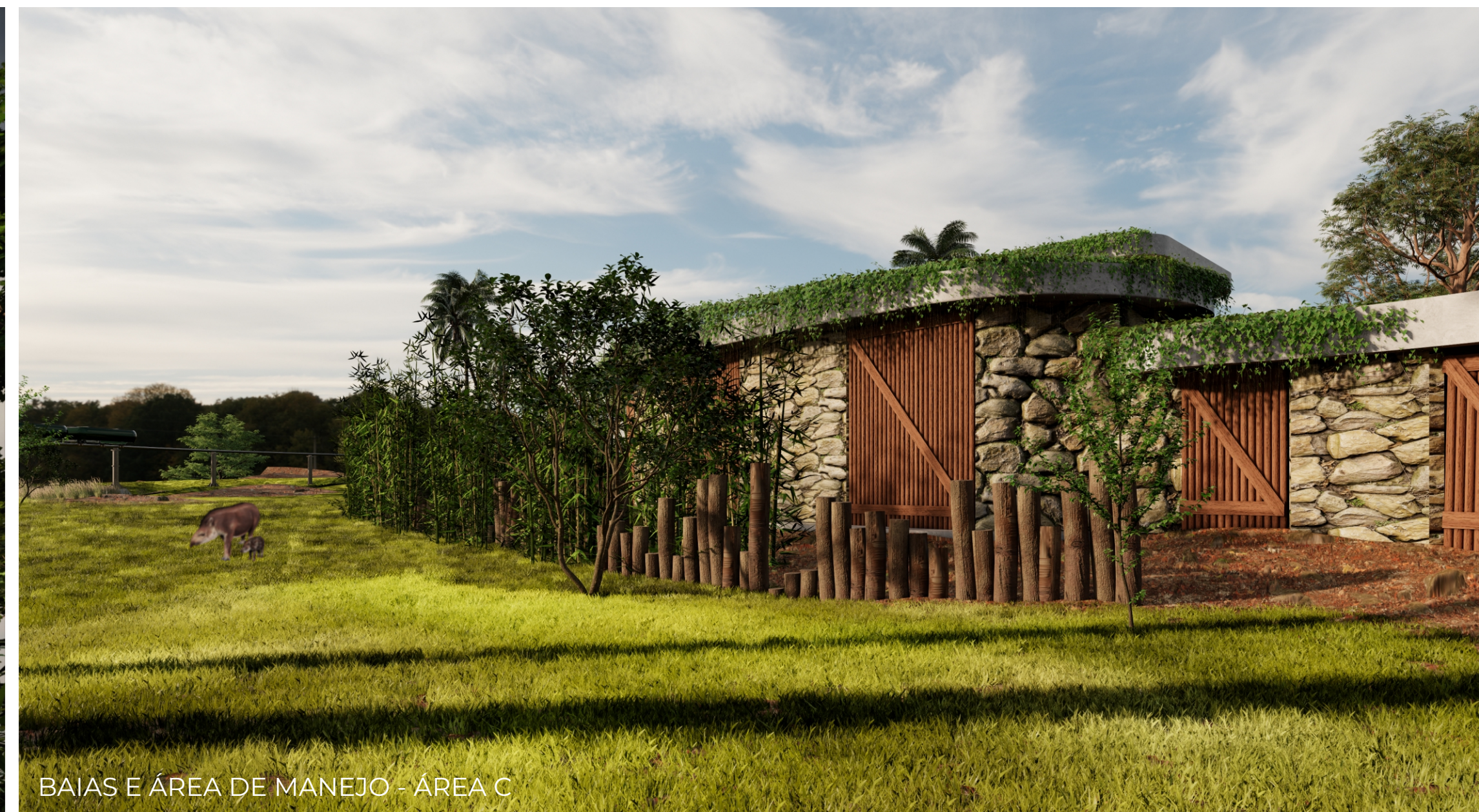
BAIAS E ÁREA DE MANEJO - ÁREA C