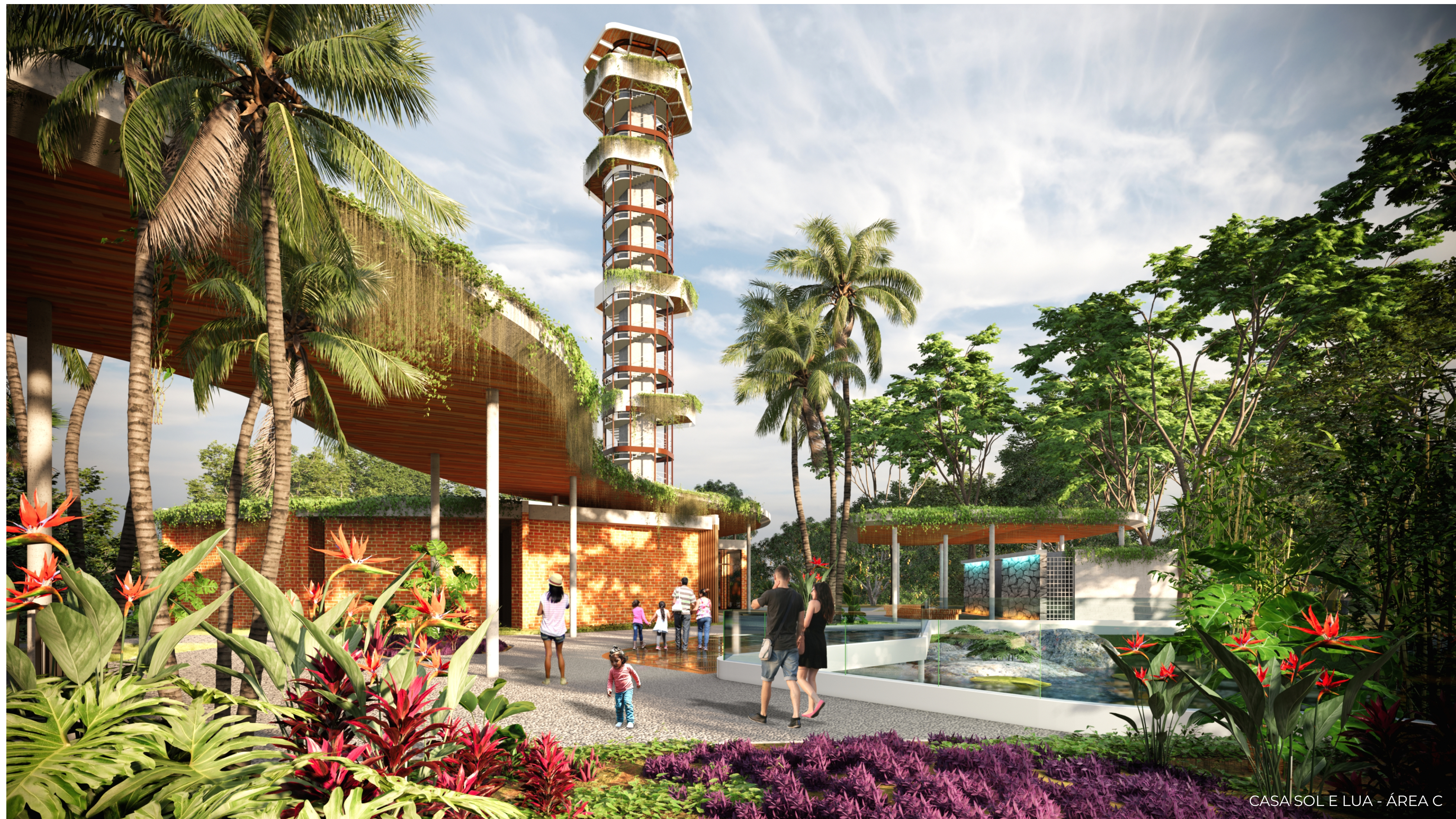
CASA SOL E LUA - ÁREA C