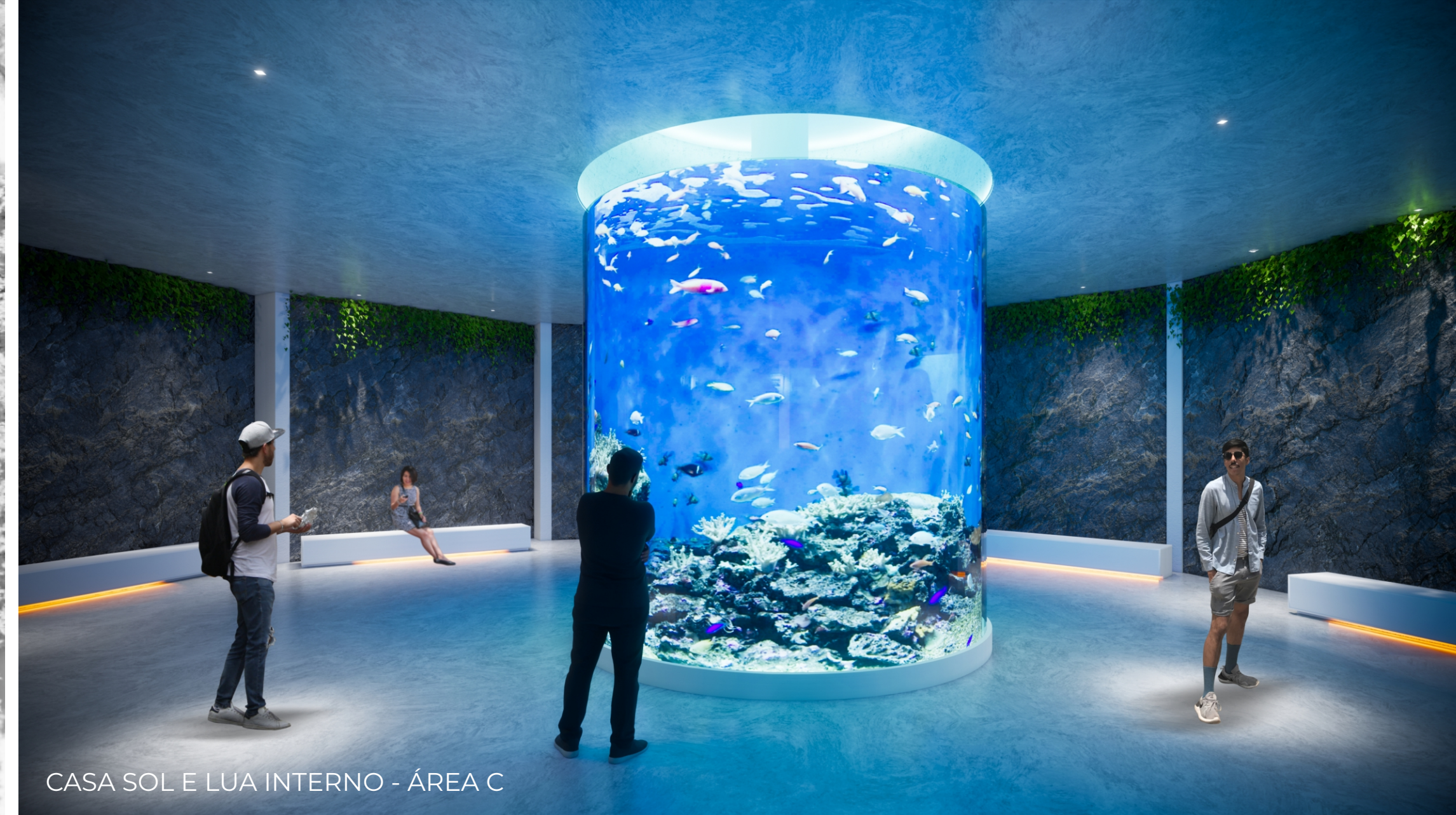
CASA SOL E LUA INTERNO - ÁREA C