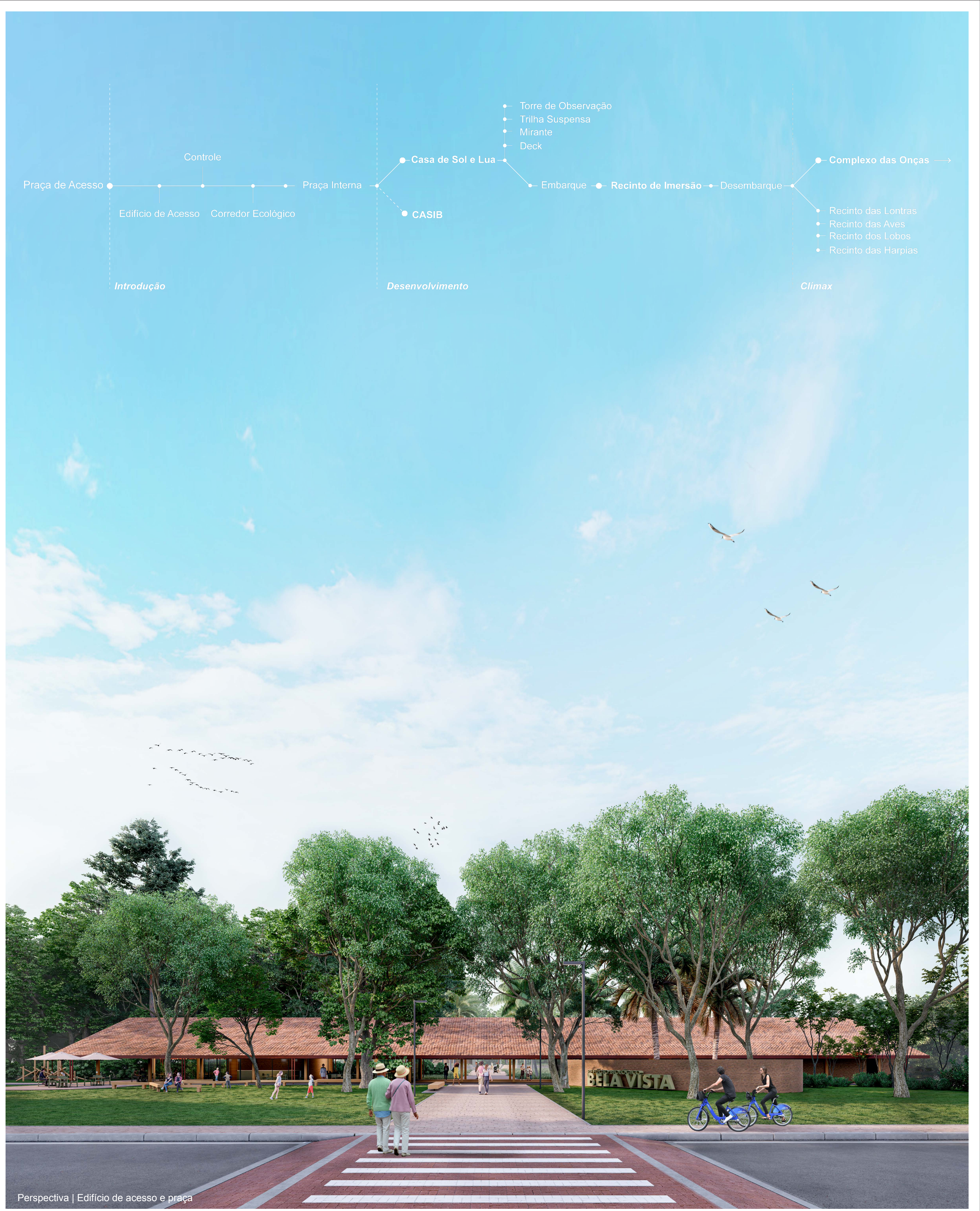
Perspectiva | Edifício de acesso e praça